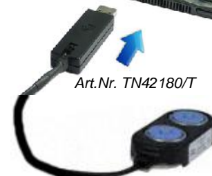
Art.Nr. TN42180/T Art.Nr. TN42170/D